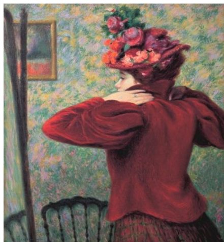
Federico Zandomeneghi : giubbotto rosso